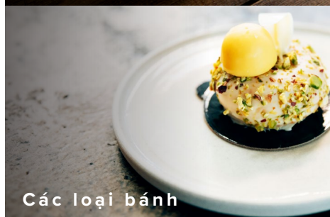
Các loại bánh