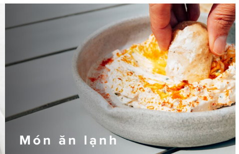
Món ăn lạnh