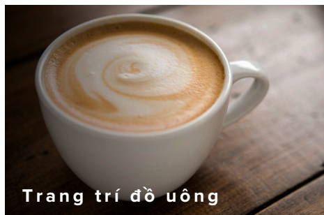
Trang trí đồ uống