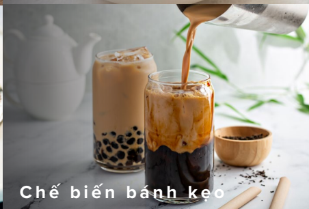
Chế biến bánh kẹo