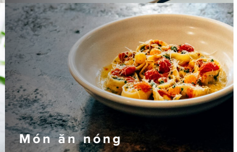
Món ăn nóng