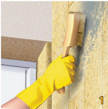
1 Vệ sinh và làm khô bề mặt tường