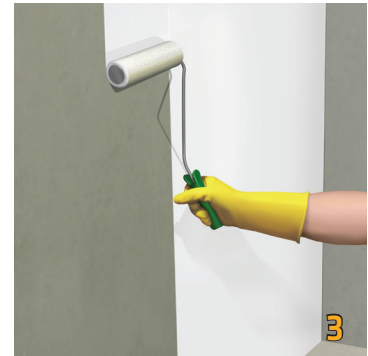
3 Thi công lớp thứ nhất Sika® RainTite bằng cọ hay rulo