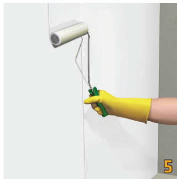
5 Thi công lớp thứ hai Sika® RainTite