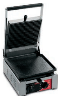
ELIO LR TIMER