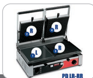
Legenda modelli Models key