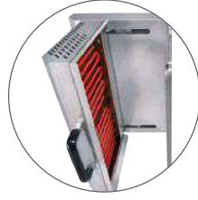
Résistances blindées / Metal heating elements