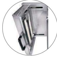
Gaz forte puissance / High power gas