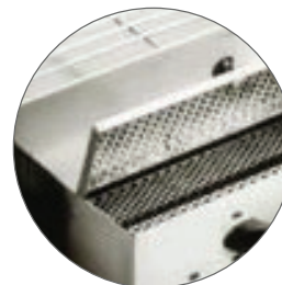
Boîtier de contrôle + ventilation / Control box + ventilation