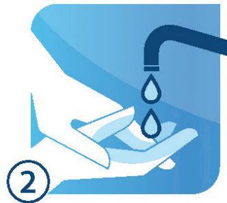
LÀM ƯỚT TAY