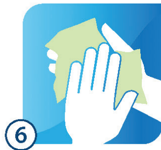
LAU KHÔ TAY