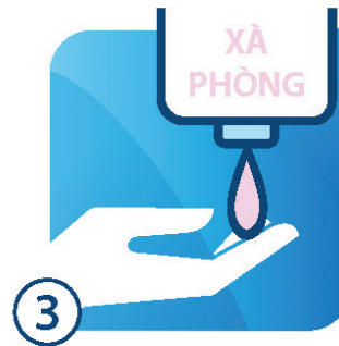
XỊT XÀ PHÒNG