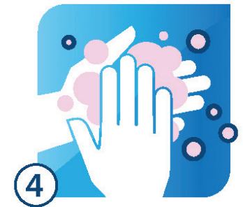
KỶ CỌ KỸ

Cọ rửa trong ít nhất 20 giây và đảm bảo làm sạch lòng bàn tay, mu bàn tay, giữa các ngón tay và dưới móng tay