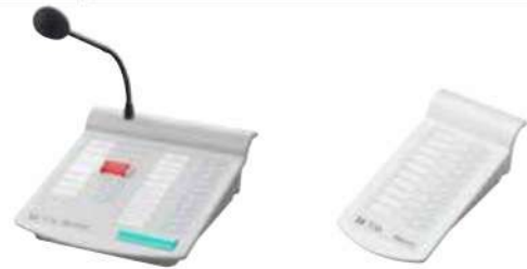
Micro chọn vùng từ xa RM-200M