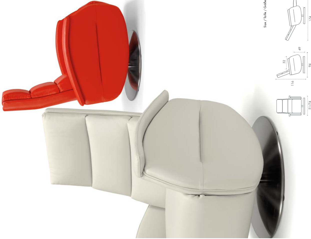
Size / Taille / Größe