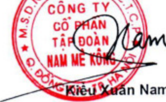
Nam Kiều Xuân Nam