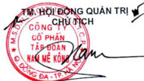
KIỀU XUÂN NAM

- Trách nhiệm và nghĩa vụ: Tuân thủ các quy định của pháp luật về Đại lý lưu ký theo Nghị định số 153/2020/NĐ-CP.