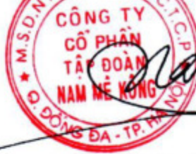
Kiều Xuân Nam