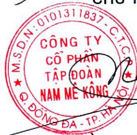
Kiều Xuân Nam