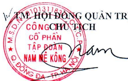
Kiều Xuân Nam