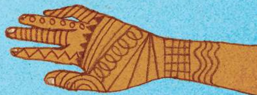
Vẽ hoa văn trên bàn tay bằng mực henna

Văn hóa được truyền từ thế hệ này sang thế hệ khác, nhưng không liên quan gì đến di truyền. Văn hóa là điều mà chúng ta học hỏi được chứ không phải sinh ra đã có. Sau đây là một vài ví dụ về các tập quán văn hóa trên thế giới.