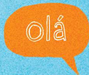
Nói tiếng Bồ Đào Nha