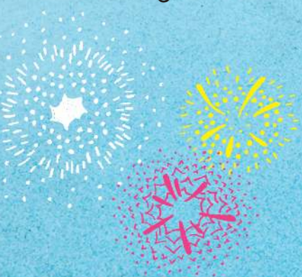
Bắn pháo hoa vào ngày Quốc khánh