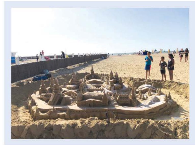
Một lâu đài cát ở bãi biển Dauville, Pháp

Kiến trúc là nghề thiết kế các công trình: nhà cửa, đường sá, thị trấn và thành phố. Nếu ai đó hỏi bạn “Bạn có hứng thú với kiến trúc không?” thì có lẽ bạn sẽ cảm thấy không biết trả lời sao. Nhưng kì thực lâu nay bạn rất hứng thú với kiến trúc đấy, và khả năng cao là bạn không hề nhận ra điều đó. Có thể một ngày nọ trên bãi biển, bạn đã xây một lâu đài cát hoành tráng với những tháp canh ở mỗi góc.