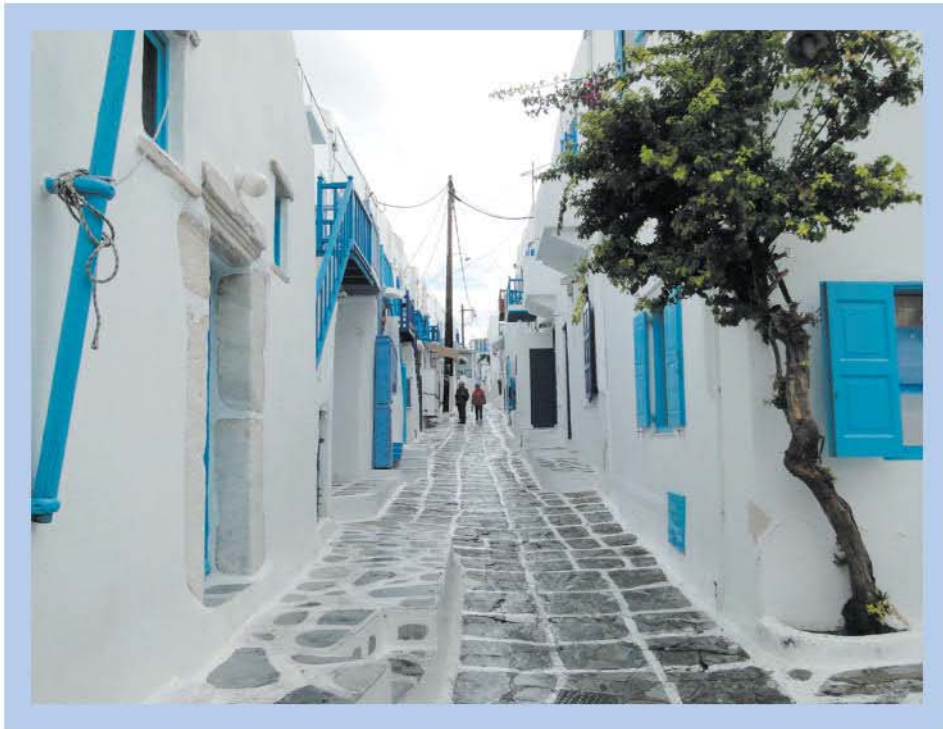
Đảo Mykonos, Hi Lạp

Hay là khi bạn có một chuyến du lịch đến Hi Lạp và thấy một con phố như thế này: