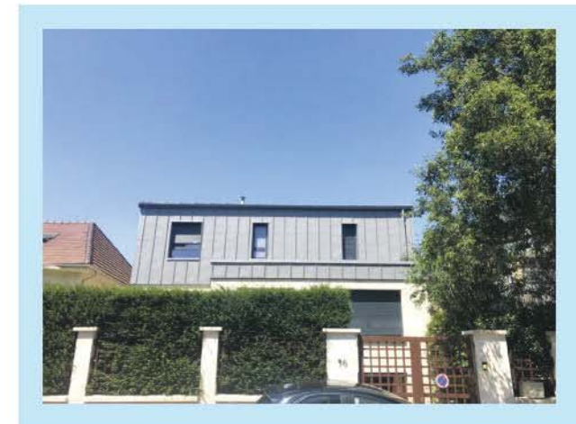
Một ngôi nhà ngoại ô ở Paris

Nhưng nghĩ đến việc phải sống trong một ngôi nhà như thế này sẽ khiến bạn hơi buồn: