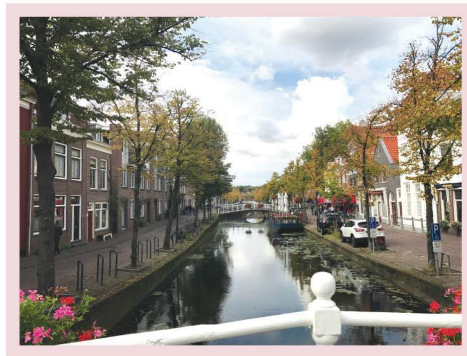
Thành phố Delft, Hà Lan

Chúng tôi còn muốn hiểu được cách để đưa nhiều hơn những công trình đẹp đến thế giới này.