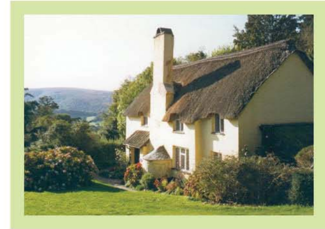
Làng Selworthy, Somerset, Anh, đầu thế kỉ 19

Có lẽ, bạn đã từng thấy một ngôi nhà thú vị như thế này ở vùng thôn quê. Sống ở đó thì chắc là thú lắm. Sung sướng thay khi được ngủ dưới mái nhà rơm kia, dễ chịu thay khi về nhà trong rét mướt, biết rằng ngôi nhà ấm cúng đang chờ đợi mình.