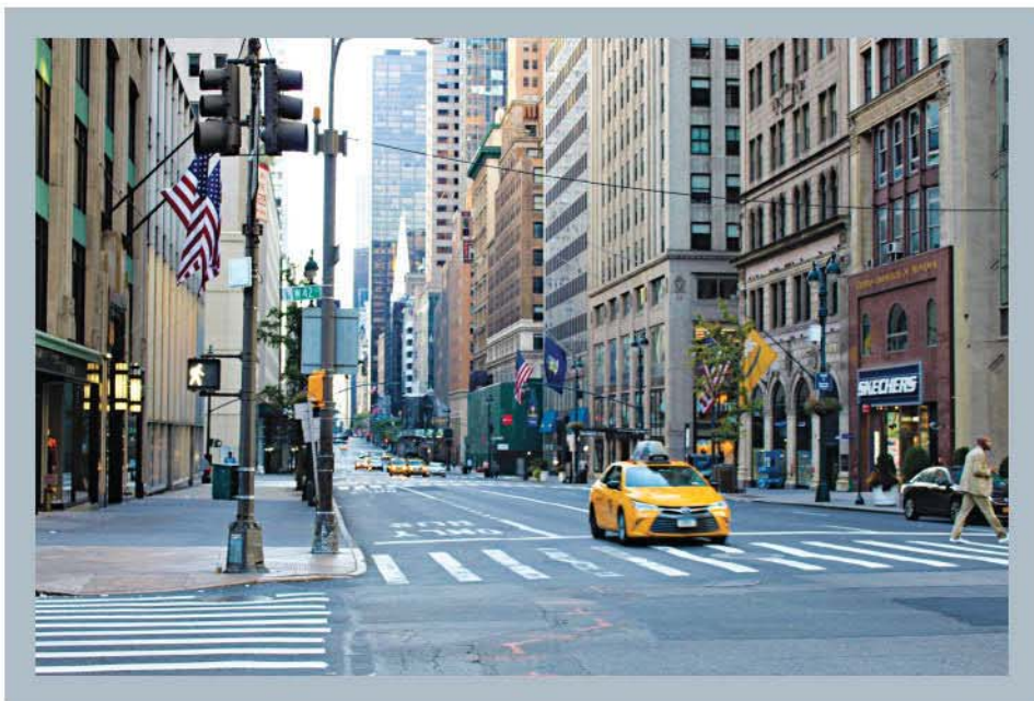
Thành phố New York, Mĩ

Nhưng rồi họ cho bạn xem một bức ảnh khác chụp vào dịp họ đi công tác.