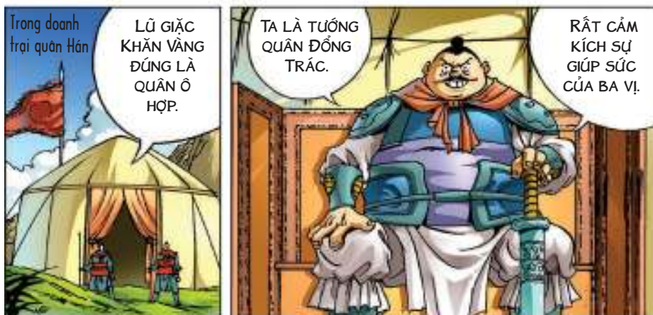
Trong truyện này, cuộc gặp gỡ giữa Đồng Trác và Lưu Bị, Quan Vũ, Trương Phi là hư cấu.