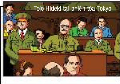
Tojo Hideki tại phiên tòa Tokyo

NHỮNG HÀNH VI CỦA CÁC NGƯỜI KHIẾN CHO CÁC QUỐC GIA BỊ CUỐN VÀO CHIẾN TRANH PHẢI CHỊU TỔN THẤT NẶNG NỀ, DO ĐÓ CÁC NGƯỜI PHẢI BỊ TRỪNG PHẠT.