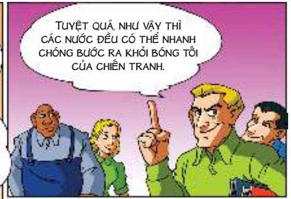
GEORGE MARSHALL - QUỐC VỤ KHANH HOA KỲ

TUYỆT QUÁ, NHƯ VẬY THÌ CÁC NƯỚC ĐỀU CÓ THỂ NHANH CHÓNG BƯỚC RA KHỎI BÓNG TỐI CỦA CHIẾN TRANH.