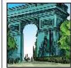
Quân Đức diễu hành qua Khải Hoàn Môn ở Paris.