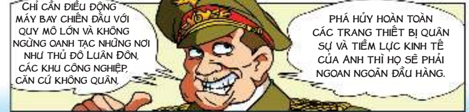
Từ tháng 7/1940, máy bay oanh tạc xuất hiện dày đặc trên bầu trời nước Anh.