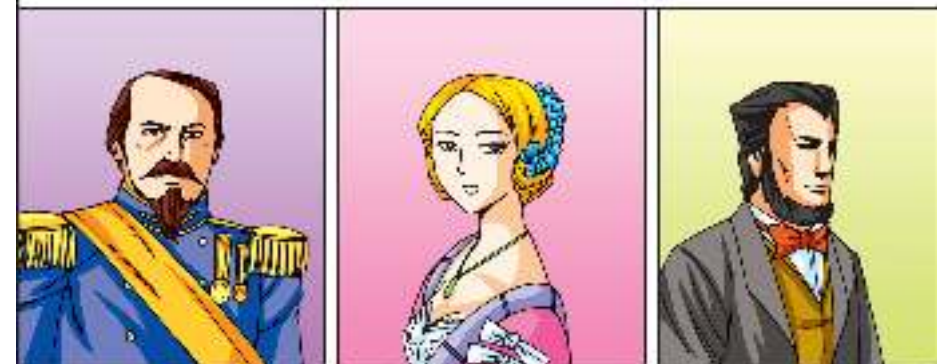
NAPOLEÓN III (1808-1873)

Thời kì thống trị của Mạc phủ Tokugawa ở Nhật Bản sắp kết thúc. Phong trào cải cách Duy tân Minh Trị bắt đầu vào năm 1868.