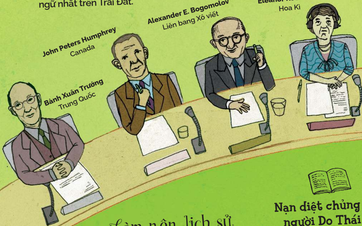
Bành Xuân Trường Trung Quốc