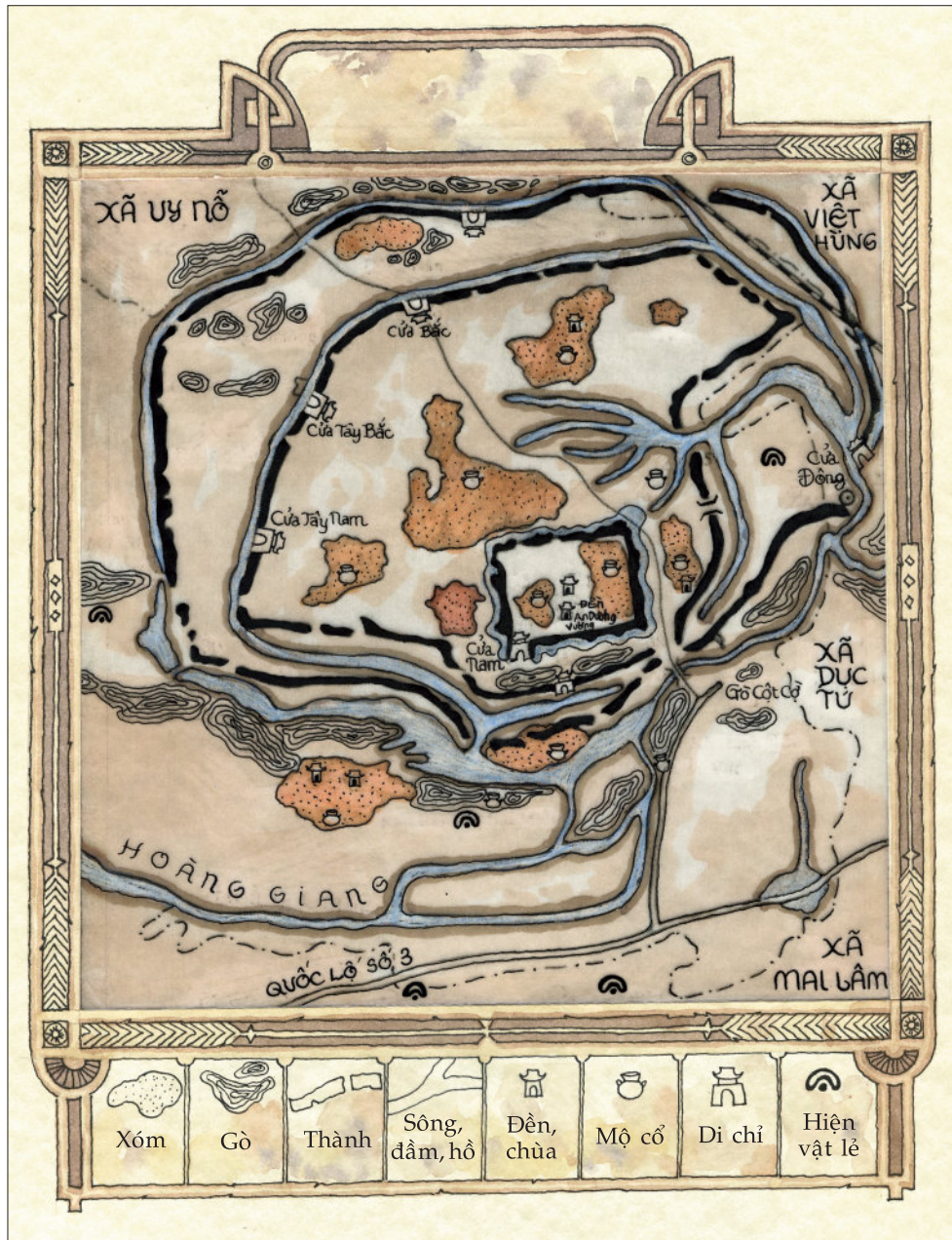
Bản đồ thành Cổ Loa

vòng thành này cũng không đều nhau. Càng về phía nam thì hai vòng càng gần nhau và được nối liền ở Trấn Nam môn.