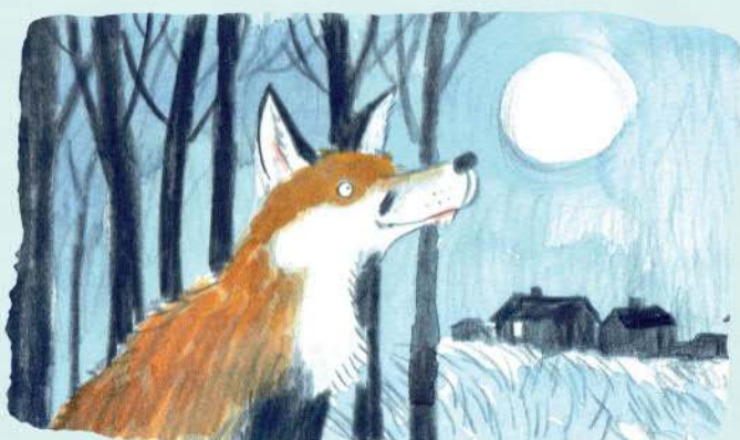
Một đêm trăng sáng, cáo tới thị trấn lân cận.