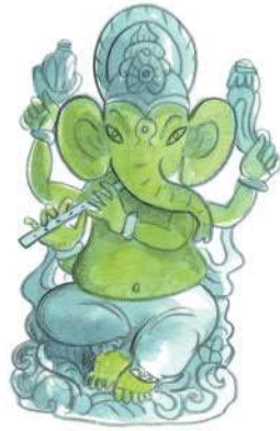
Thần Ganesh thường được thể hiện là đang thổi sáo.

Từ xa xưa, con người đã dùng âm nhạc để ca ngợi các vị thần. Người theo đạo Hindu dùng những ngôn từ trong kinh Vệ-đà – các văn bản thiêng cổ xưa của họ trong các bài cầu kinh và bài hát thiêng liêng ca ngợi thần Shiva vĩ đại cùng các vị thần Hindu khác, như thần voi Ganesh. Người Hồi giáo cũng ca hát khi tiến hành các nghi lễ thờ cúng. Vào thế kỉ 13 ở Ấn Độ và nơi ngày nay là Pakistan, người Hồi giáo Sufi đã phát triển một loại hình âm nhạc sùng đạo gọi là Qawwali. Những người theo Kitô giáo thường hình dung thiên đường có nhiều dàn đồng ca với các thiên thần ca hát, và các nghi thức phụng thờ của họ ngày nay cũng bao gồm rất nhiều hoạt động ca hát (ví dụ như một buổi lễ hát mừng Giáng sinh hoặc các dàn đồng ca phúc âm của người Mỹ gốc Phi). Các dàn đồng ca Kitô giáo khởi nguồn từ những bài bình ca Gregoria của các tu sĩ châu Âu thế kỉ thứ 8. Dần dần nó phát triển thành những giai điệu được gọi là bài đồng ca, khi mọi người cùng hòa nhịp và hát.