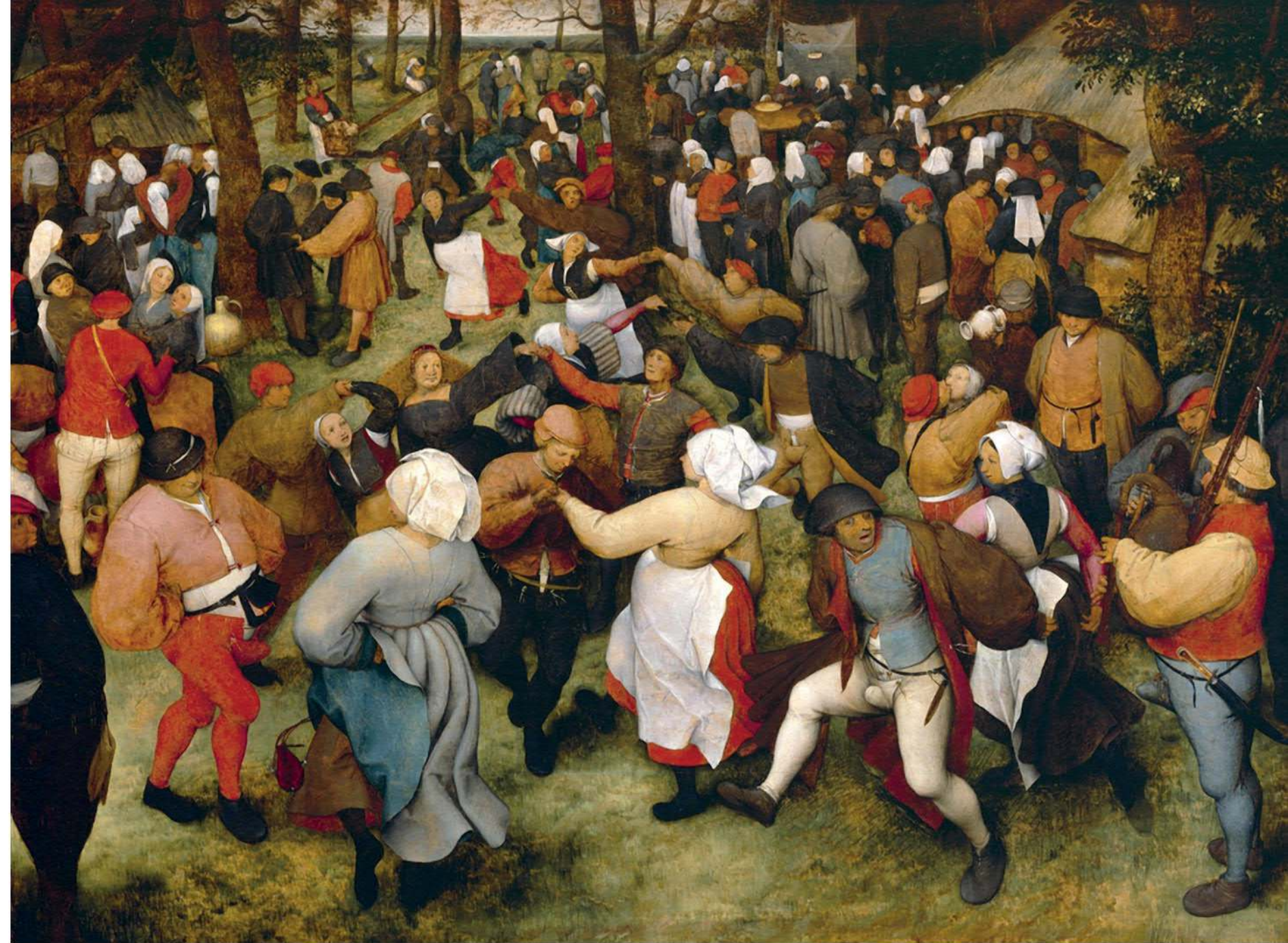
Mọi người nhảy theo giai điệu dân ca trong bức tranh từ thế kỉ 16 có tựa đề The Wedding Dance của nghệ sĩ người Hà Lan Pieter Bruegel Già. Bạn có nghe thấy tiếng kèn túi không? Các điệu nhảy đồng quê từng là cách thông thường nhất để các đôi trai gái gặp gỡ.

Cùng thử nghe nhạc dân gian truyền thống từ khắp nơi trên thế giới: “Crane Dance”, một giai điệu truyền thống của Nhật Bản; nhạc yoik của người Sami ở Lapland (Phần Lan); và thử nghe vài khúc dân ca Celtic như “Dirty Old Town” do The Pogues thể hiện hoặc “The Gael” của Dougie MacLean. Burl Ives đã hát một phiên bản nổi tiếng của bài “A Fox Went Out On a Chilly Night”.