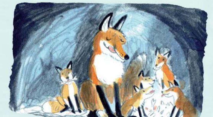
Nhưng con cáo đã trốn thoát được về hang để tận hưởng bữa tiệc thịnh soạn cùng các con. Bài hát có câu: “Mấy con cáo con nhai xương rau rầu”.