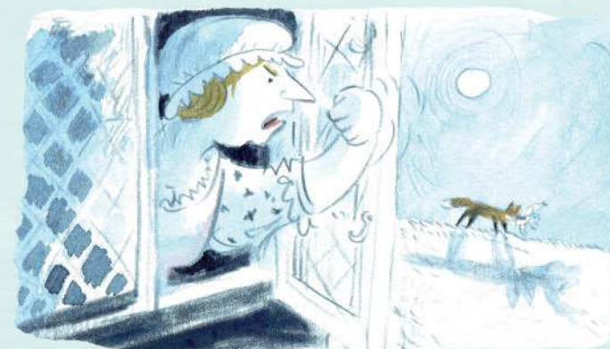
Con cáo đột nhập khiến bà già Flipper Flopper tỉnh ngủ, và bà hét lên báo động.