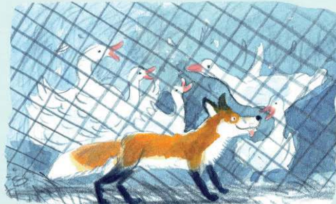
Tại đây, nó bắt gặp một chuồng vịt và ngỡ. “Một cặp vịt sẽ là bữa ăn cho ta”, trích lời con cáo trong bài hát.