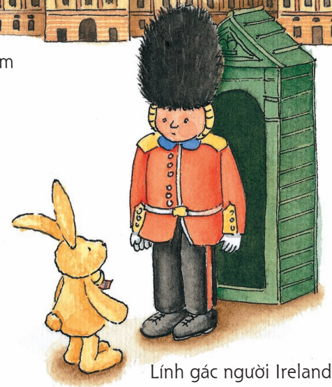
Lính gác người Ireland