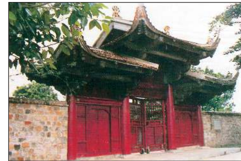
Tam quan chùa Kim Liên (Nghị Tàm, Tây Hồ, Hà Nội). Kiến trúc thế kỉ 18.