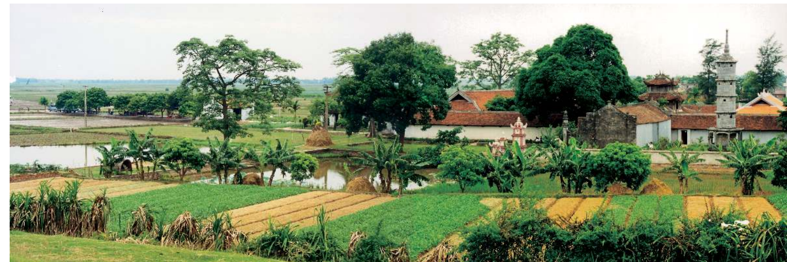
Toàn cảnh chùa Bút Tháp (Đình Tổ, Thuận Thành, Bắc Ninh)

Chùa cũng góp phần phát triển kiến trúc. Chùa Tây Phương (Hà Nội) dựng lại năm 1794 theo kiểu chùa Kim Liên (Hà Nội, dựng năm 1792) đã đạt tới chuẩn cổ điển của kiến trúc chùa Việt Nam, với sự cân đối hài hòa, các kiểu thức vì kèo, đầu đao, phân chia không gian trong nhà, tỉ lệ và phong cách trang trí vừa phải.