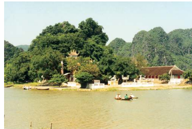
Đường lên Thiên Trù, chùa Hương (Hương Sơn, Mỹ Đức, Hà Nội).

Chùa Hương là một điểm du lịch nổi tiếng trong nước. Đi thuyền giữa một "Hạ Long thu nhỏ", vào đến Trình, rồi lại xuống thuyền qua cầu Hội, tới bến Trò thăm chùa Thiên Trù, vào chùa Tiên có thơ đề của chúa Trịnh Sâm ca ngợi nơi đây cảnh đẹp nhất trời Nam. Chùa Giải Oan có suối Giải Oan. Dù mỗi gỏi chồn chân ai cũng muốn vào tới chùa trong, tức động Hương Tích.