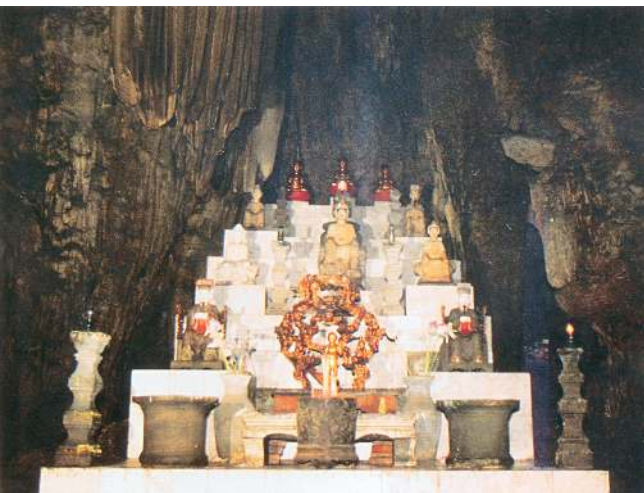
Tượng Phật trong động Hương Tích, chùa Hương (Hương Sơn, Mỹ Đức, Hà Nội).

Ai muốn cầu tự cũng cầu ở đây: Hòn Cô - Hòn Cậu. Rồi hôm sau xuống núi trở về bến Yến Vĩ. Đi chùa Hương thông thả phải mấy ngày để thả lòng cùng non xanh, nước biếc.