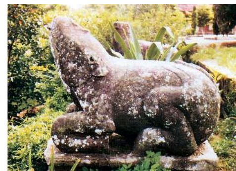
Tượng thú bằng đá. Chùa Phật Tích (Tiên Du, Bắc Ninh). 1057. Dài 150 cm, cao 120 cm.

Thiên nhiên vây quanh là cái nôi của ngôi chùa. Chùa ở trong thắng cảnh như con ở trong lòng mẹ.