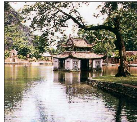
Thầy đình chùa Thầy (Sài Sơn, Quốc Oai, Hà Nội).

Chùa Trăm Gian có tên gọi như thế vì có đủ 100 gian nhà, nằm ở lưng chừng núi, thông reo vi vu, nhìn xuống xóm làng yên ả, kiến trúc độc đáo, nhiều tượng đẹp, trong đó có tượng Đò đốc Đặng Tiến Đông của nhà Tây Sơn.