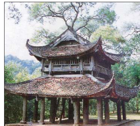
Gác chuông chùa Trăm Gian (Chương Mỹ, Hà Nội).