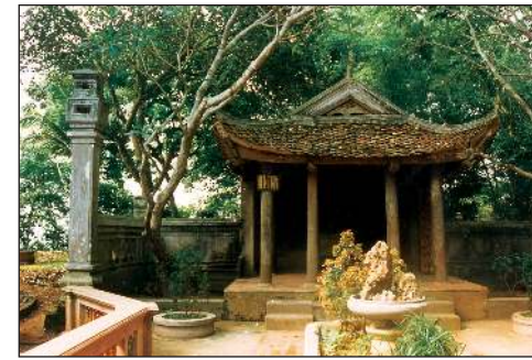
Miếu Sơn thần chùa Tây Phương (Thạch Xá, Thạch Thất, Hà Nội).

Văn cảnh chùa là hương thụ nghệ thuật nhưng nhiều khi bị tục lệ mê tín lấn át.