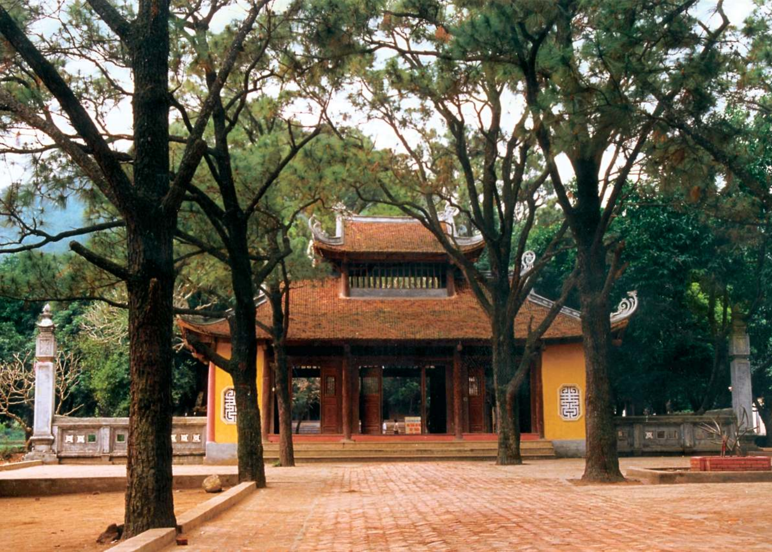
Chùa Côn Sơn, Chí Linh, Hải Dương.

Chùa Côn Sơn (Hải Dương) gắn với Nguyễn Trãi khi ông ở ẩn.