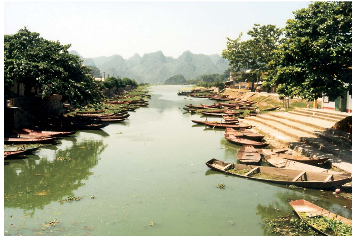
Bến Đục, suối Yến.

Hôm nay đi chùa Hương Hoa cỏ mờ hơi sương... —Nguyễn Nhược Pháp.