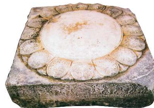
Thạch tảng chạm khắc đá ở đầu kê chân cột, chùa Phật Tích (Tiên Du, Bắc Ninh). 1057. 72 x 72 x 17 cm.

Năm 1010, nhà Lý dời đô từ Hoa Lư đến Thăng Long. Nhà Lý cũng là thời kì khởi đầu rực rỡ cho việc xây dựng chùa.