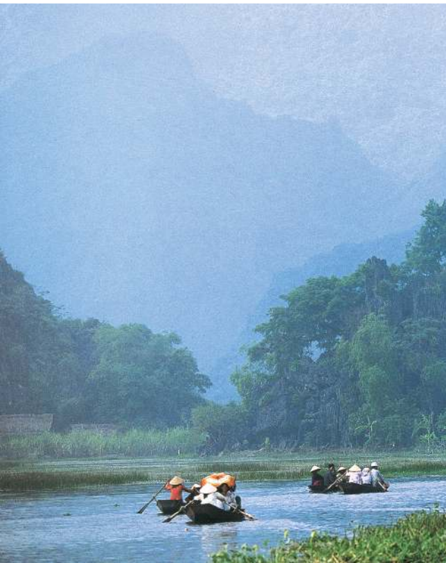
Suối Yến, chùa Hương (Hương Sơn, Mỹ Đức, Hà Nội).