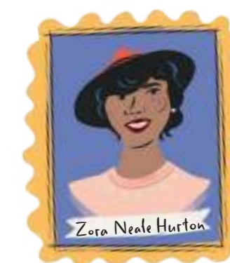
Zora Neale Hurston