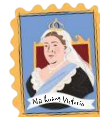
Nữ hoàng Victoria