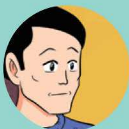
Bố Tiết Kiệm