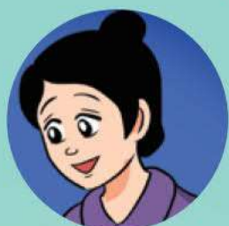
Mẹ Kim Ngân