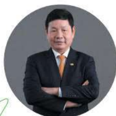
Phó Giáo sư, Tiến sĩ Trương Gia Bình Chủ tịch HĐQT Công ty Cổ phần FPT

"Nên đọc cuốn sách! Tôi mong các gia đình và học sinh hãy đọc và sẽ tìm thấy sự độc đáo, hữu ích, bất ngờ, sáng tạo và thú vị trong cuốn truyện tranh về tài chính thắm đẫm tình người này. Đây là cuốn sách mà ai đọc cũng thấy mình ở trong đó. Cuốn sách có tính ứng dụng, thực hành cao và để lại cho chúng ta nhiều suy nghĩ về cuộc sống, nhất là những bài học nhằm tránh rủi ro tài chính và đầu tư. Khi chúng ta có hiểu biết về tài chính, cuộc sống sẽ tốt đẹp hơn, sống có khát vọng, trách nhiệm hơn với bản thân, gia đình và xã hội. Cuốn sách có ý nghĩa nâng cao dân trí quốc gia về tài chính."