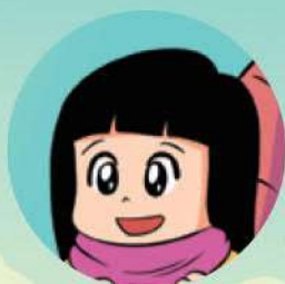
Em gái Tài Chính