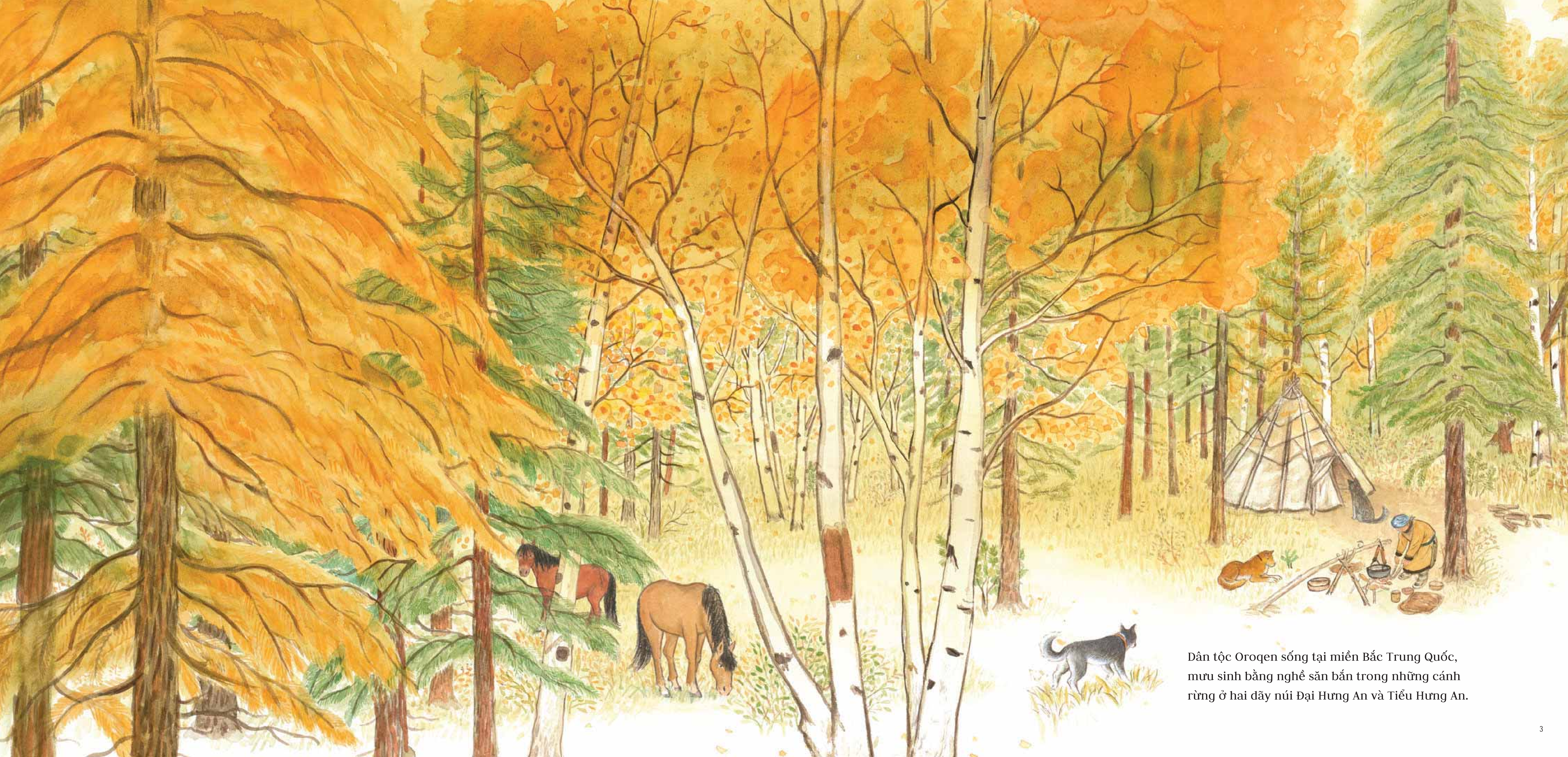
Dân tộc Oroqen sống tại miền Bắc Trung Quốc, mưu sinh bằng nghề săn bắn trong những cánh rừng ở hai dãy núi Đại Hưng An và Tiểu Hưng An.