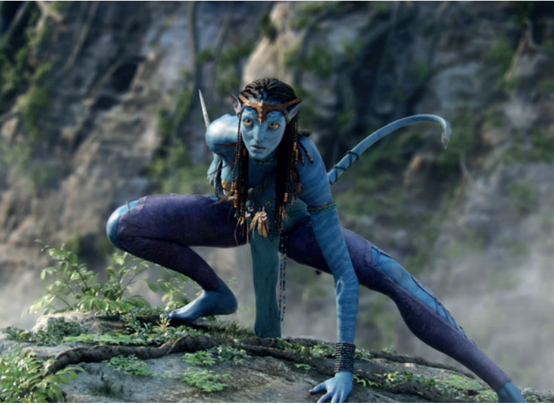
Điện ảnh có thể giới thiệu các thế giới và con người tưởng tượng, như trong bộ phim Thế thân (2009) do James Cameron đạo diễn.

phim yêu thích rồi tìm thấy những tác phẩm đã truyền cảm hứng cho họ, và ngược lại, các tác phẩm họ đã truyền cảm hứng. Mỗi chương chủ đề cũng bao gồm một bảng chú giải các thuật ngữ quan trọng, phần tiểu sử của một nhân vật chủ chốt, mang đến kiến thức cơ bản cần thiết giúp bạn đào sâu hơn về phim ảnh. Hành trình này sẽ đưa bạn đến nhiều lục địa và khu vực khác nhau, tiếp cận các bộ phim không kể chuyện theo cách thông thường hoặc thậm chí không hề kể chuyện. Màn ảnh rộng mang đến cơ hội để mở rộng chân trời của bạn.