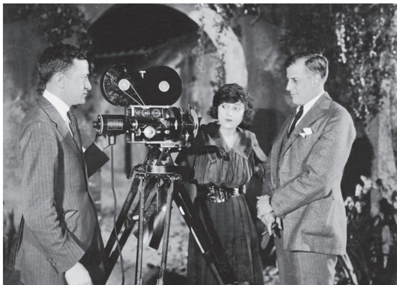
Từ các máy quay phim đầu tiên đến mô phỏng hình ảnh bằng máy tính và rạp phim 4D, các tiến bộ công nghệ đã định hướng cách chúng ta sản xuất và thưởng thức phim ảnh.

Đây là quyển sách giúp bạn khám phá khung cảnh đầy biến động này. Chúng ta sẽ khởi hành chuyến đi ở giai đoạn ban đầu là những ngày khai phá thuộc thời kì phim câm, đi qua các khoảnh khắc sáng tạo đã ảnh hưởng sâu sắc đến những bộ phim bạn xem ngày nay.