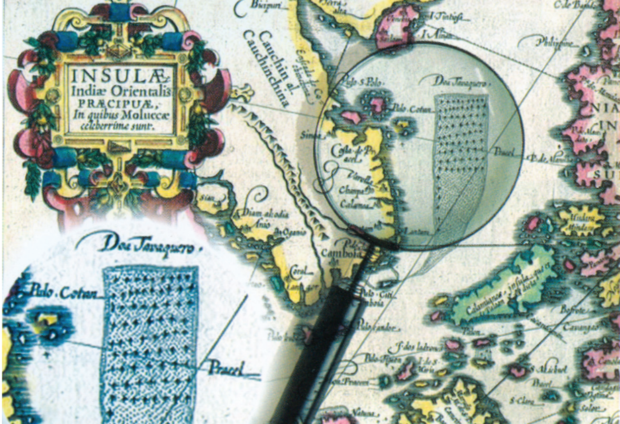
Bản đồ vùng biển Đông Nam Á do nhà địa lí người Hà Lan Jodocus Hondius vẽ và ghi chú khoảng trước năm 1606