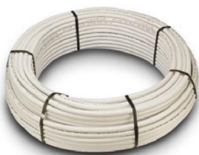
Tubería PEX/AL/PEX en Rollo - PEX/AL/PEX Multilayer Pipes - Tubes Multicouche PEX/AL/PEX