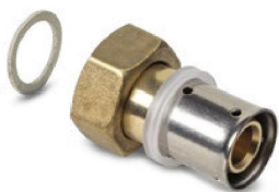
Racor Móvil - Female Loose Fitting - Raccord Femelle Ecrou Tournant