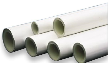
Tubería PEX/AL/PEX en Barra - PEX/AL/PEX Pipes in bars - Tubes en barre PEX/AL/PEX