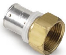
Racor Fijo Rosca Hembra - Fixed Fitting with Female Thread - Raccord Femelle Fixe