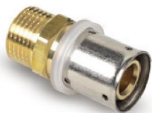
Racor Fijo Rosca Macho - Fixed Fitting with Male Thread - Raccord Mâle Fixe