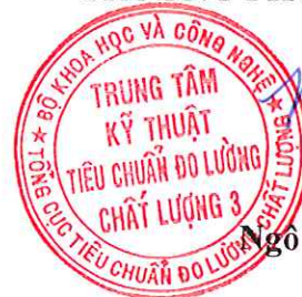
Ngô Quốc Việt