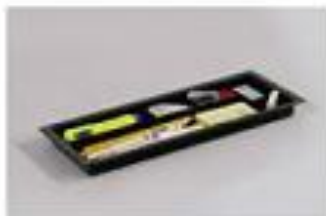
▲ Khay nhỏ đặt trong ngăn kéo nhỏ