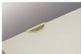
▲ Lỗ luồn dây điện