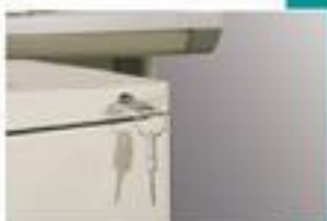
▲ Ổ khóa chuyên dụng