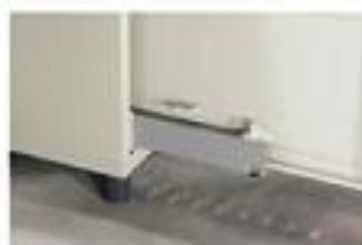
▲ Thanh trượt chịu tải trọng lớn