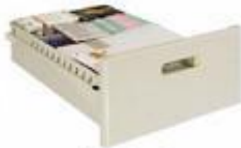
Ngăn kéo trung