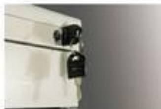
▲ Ổ khóa chuyên dùng