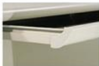
▲ Khay bàn