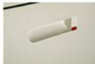
▲ Tay nắm