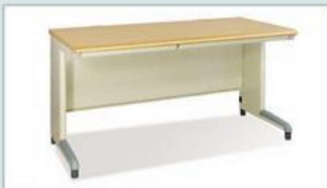
BS14 - LV (1400x700x740)