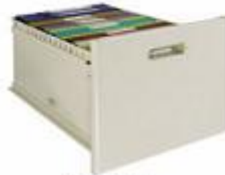
Ngăn kéo to