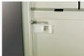
▲ Chốt hãm ngăn kéo