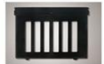
▲ Tấm ngăn