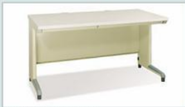
BS14 - MG (1400x700x740)