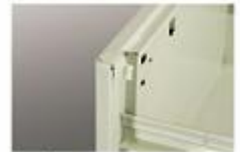
▲ Ốp nhựa bảo vệ phía trên ngăn kéo