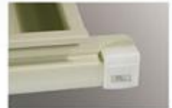
▲ Phiến dẫn nhựa chống ồn

Chế tạo chính xác, khay ngăn kéo đóng mở nhẹ nhàng, sức chứa tuyệt vời, chịu tải trọng cao, bền vững với thời gian!