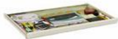
Khay kéo mỏng