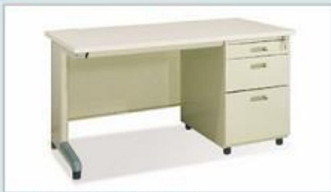
BS12H - MG (1200x700x740)