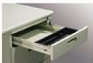
▲ Ngăn kéo nhỏ có khay đựng bút