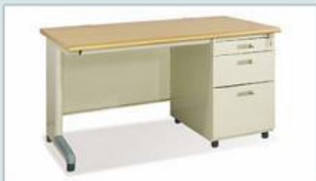
BS12H - LV (1200x700x740)