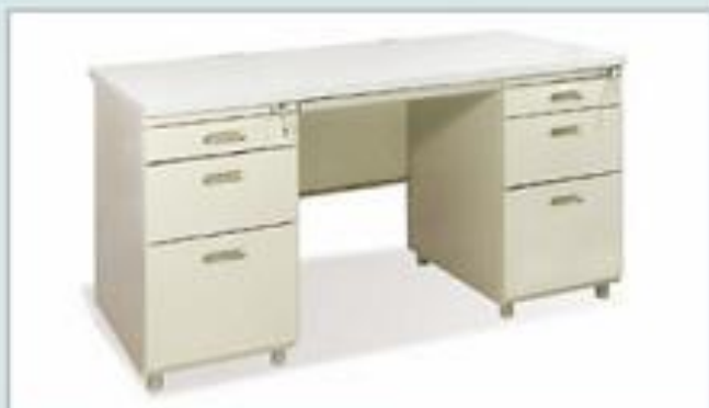
BS14H - MG (1400x700x740)