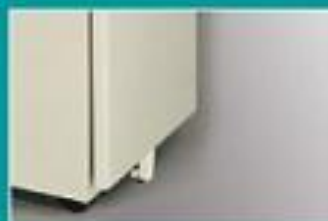
▲ Bánh xe đỡ phía đầu khay to