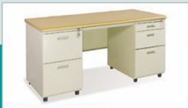
BS14H - LV (1400x700x740)