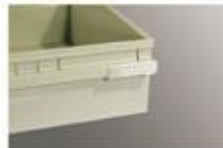
▲ Chốt nhựa bảo vệ ngăn kéo