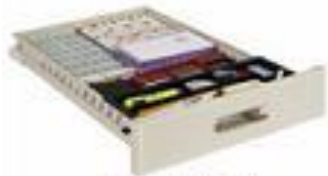
Ngăn kéo nhỏ