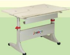
BHS02B-LG 800W x 695D x (550-760)H

Sản phẩm bàn, ghế học sinh Junior của Nội thất 190 thỏa mãn 3 điều kiện học: - Học bài - Suy nghĩ - Nghỉ ngơi ; - và 2 trạng thái học: - Viết - Đọc Phù hợp cho trẻ em từ học lớp 1 đến lớp 12.