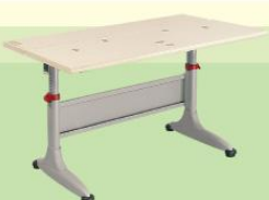
BHS02-LG 1150W x 725D x (550-760)H