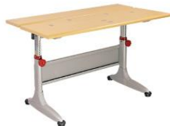
BHS01-LV 1150W x 725D x (550-760)H