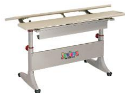
BHS01-LG 1150W x 725D x (550-760)H