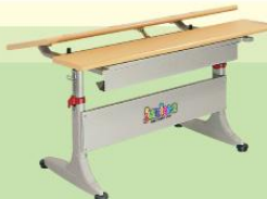
BHS02-LV 1150W x 725D x (550-760)H

Tự nâng mặt bàn, khóa hãm chân bàn bằng chốt xoay