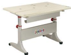
BHS01B-LG 800W x 695D x (550-760)H