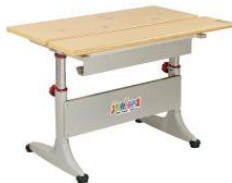
BHS01B-LV 800W x 695D x (550-760)H