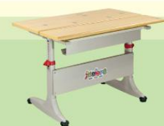
BHS02B-LV 800W x 695D x (550-760)H