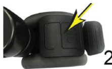
Nhấn vào để mở