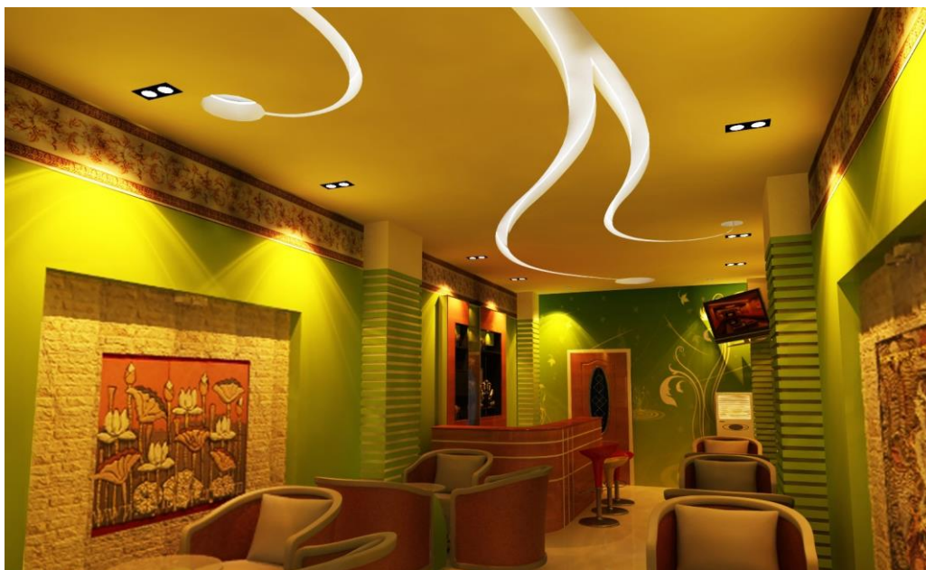
2 loại đèn VDG2A có công suất 14W và 24W

Gấp đôi đèn, gấp đôi công suất, điều đó có nghĩa là chiếc đèn VDG2A này sẽ có công suất bằng 2 chiếc đèn LED downlight đơn công lại. Điều này vừa có ưu điểm, vừa có nhược điểm. Ưu điểm ở chỗ bạn sẽ không còn phải lắp quá nhiều đèn LED trên một diện tích trong nhà để có đủ ánh sáng, giờ đây chỉ một chiếc đèn VDG2A nhỏ xinh, bạn đã có cường độ sáng gấp đôi đèn bình thường. Đây cũng chính là nhược điểm của chiếc đèn này, bởi sẽ có lúc bạn không có nhu cầu cho hai bóng sáng cùng lúc nhưng lại chỉ có một công tắc dùng chung. Tuy nhiên, bạn cũng đừng vội lo lắng vì Việt Vương đã khắc phục được nhược điểm này bằng cách đưa ra nguyên tắc sử dụng DIM giúp khách hàng có thể điều chỉnh cường độ ánh sáng của đèn một cách dễ dàng bằng nút DIM.