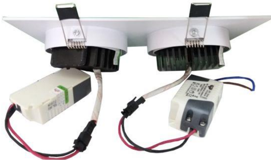
Mặt sau đèn VDG2A Việt Vương

Đúng như tên gọi của mình, đèn LED đôi là sự kết hợp của hai đèn downlight cùng kích cỡ cùng nằm trên một mặt phẳng hình chữ nhật, trong đó hai chóa đèn gắn liền với tụ xoay nên bạn có thể điều chỉnh góc chiếu dễ dàng bằng cách ấn nhẹ vào đèn. Nhìn chung, Việt Vương thiết kế VDG2A khá đơn giản, nhỏ gọn nhưng cũng rất tinh tế, phù hợp với các không gian cần điểm nhấn, khác lạ.