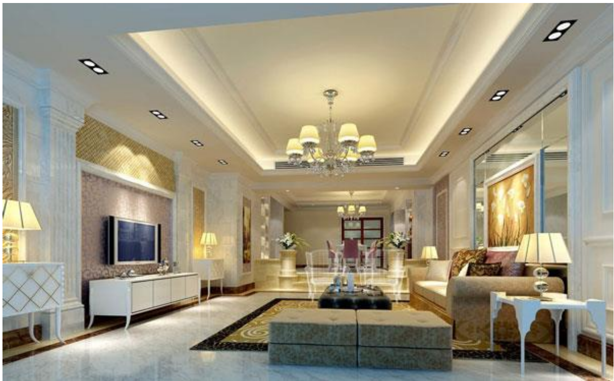
Đèn LED downlight đôi cho 3 màu ánh sáng: trắng, vàng và trung tính

Được biết, VDG2A được thiết kế có phần mặt đèn làm bằng nhựa tán quang chống chói nên dù phát ra lượng ánh sáng lớn nhưng tuyệt đối không gây hại mắt người sử dụng. Thêm vào đó, chóa đèn cũng là một mặt phẳng tạo ra góc chiếu rộng 120° và có thể xoay góc 40° nên rất dễ dàng thay thế hoặc chuyển đổi công dụng đèn từ chiếu sáng điểm sang chiếu tán quang. Với đặc điểm này, bạn nên tận dụng lắp đặt đèn ở những nơi có trần thấp hoặc các khu vực cần được chiếu sáng từng vùng sáng – tối đơn lẻ, để có thể dễ dàng với tay thay đổi góc chiếu của đèn trong vòng một nốt nhạc.