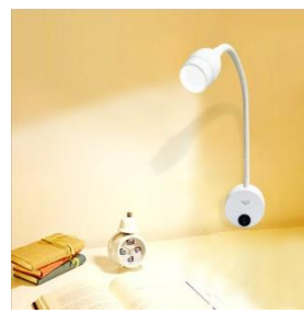
Đèn Led đọc sách có thể sử dụng với nhiều mục đích khác

Đèn Led đọc sách của Việt Vương không chỉ chuyên dùng để đọc sách mà còn là thiết bị chiếu sáng đa-zinăng trong mỗi gia đình. Đặc biệt, các khách sạn, resort cũng nên lắp sản phẩm này ở đầu giường như một thiết bị chiếu sáng thông minh, vừa thay thế cho đèn ngủ vừa tạo sự tiện lợi cho khách thuê phòng.