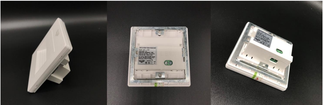
Các thông tin ghi trên đèn Led bậc thang Việt Vương

Đây là đặc điểm được hầu hết người dùng quan tâm. Đối với đèn Led bậc thang thì độ bền phụ thuộc hầu hết vào chip Led và nguồn Led.