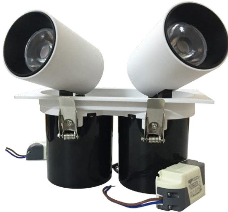
Đèn LED downlight đôi VDG1B

Cầm trên tay chiếc đèn downlight đôi VDG1B, bạn sẽ không khó để nhận ra nó mang hơi hướng phong cách Châu Âu hiện đại, được thiết kế tinh tế, sang trọng nhờ vào sự kết hợp ăn ý giữa những mảng màu đen trắng và những đường cong hoàn hảo.