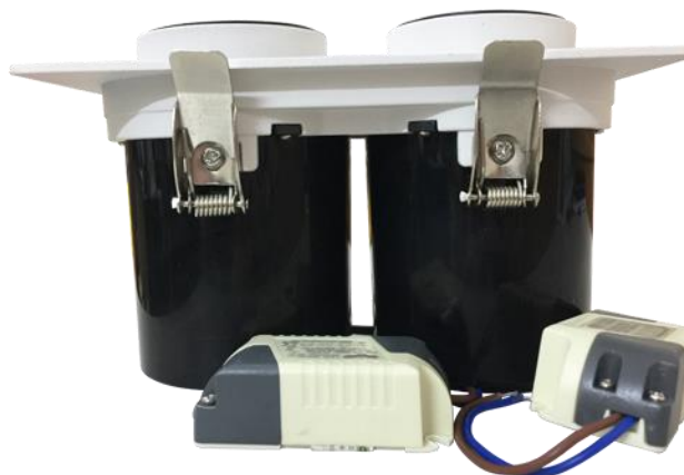
VDG1B được làm từ nhôm đúc nguyên chất

Được làm từ nhôm đúc nguyên chất nên VDG1B khá nặng tay và hầm hố. Có thể nói, với chất liệu này, phần vỏ đã trở thành lớp áo giáp bảo vệ đèn rất tốt khỏi những tác động cơ học từ bên ngoài. So với các loại downlight khác, VDG1B có bộ phận tản nhiệt giấu vào trong hốc đèn vừa đảm bảo tính thẩm mỹ, vừa giúp đèn trở nên gọn gàng hơn. Nếu bạn đang thắc mắc liệu điều này có làm khả năng tản nhiệt kém đi không thì đừng lo, bởi khi sử dụng, phần hốc đèn thường được kéo hướng ra bên ngoài, toàn bộ nhiệt năng tỏa ra khi đó sẽ phát tán nhanh vào không khí. Ngoài ra, nhôm cũng là vật liệu có đặc tính dẫn nhiệt tốt nên chắc chắn thiết kế như vậy hoàn toàn không có ảnh hưởng đến khả năng tản nhiệt của đèn.