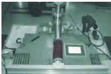
当社試験設備における検査風景

●各変位は許容変位量の範囲でご使用ください。 ●表中に示す各変位量は、偏心量も含めて単独変位の場合を示しますので複合変位の場合は補正を要します。補正方法については「取扱上の注意」または「TOZEN HP」をご参照ください。 ●表中に示す許容限界ねじりは繰返し変位ではありません。