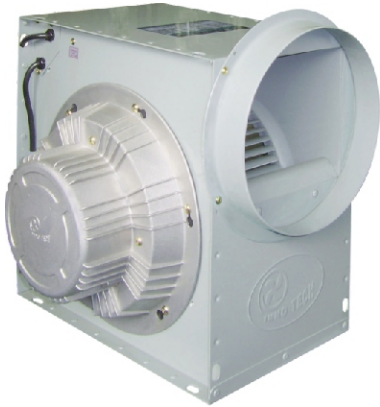
TIS-250GS, GT TIS-280GS, GT TIS-290GS