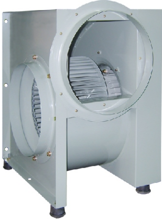
TIS-310GS, GT TIS-370GS, GT