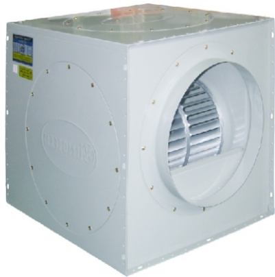
ITC-230GS, GT ITC-250GS, GT ITC-300GS, GT