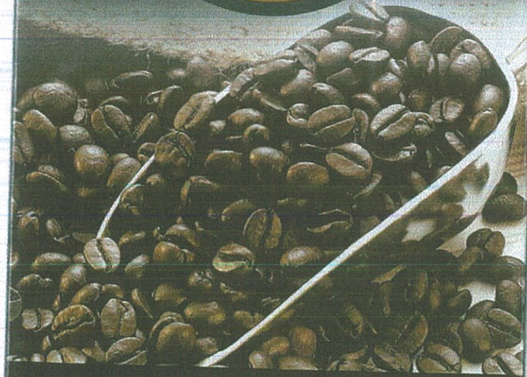
Mặt lưới bao bì cà phê Rang Củi. 500g