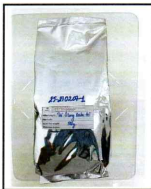
Photo of the submitted sample (if any)/ Hình ảnh mẫu phân tích (nếu có)

-- End of the Report/ Kết thúc Báo cáo --