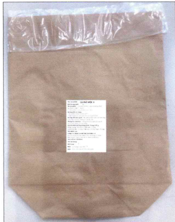
Hình ảnh tem nhãn, bao bì sản phẩm

Handwritten signature or mark in blue ink.