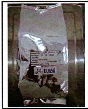
Photo of the submitted sample (if any)/ Hình ảnh mẫu phân tích (nếu có)