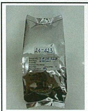
Photo of the submitted sample (if any)/ Hình ảnh mẫu phân tích (nếu có)