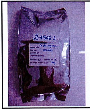
Photo of the submitted sample (if any)/ Hình ảnh mẫu phân tích (nếu có)