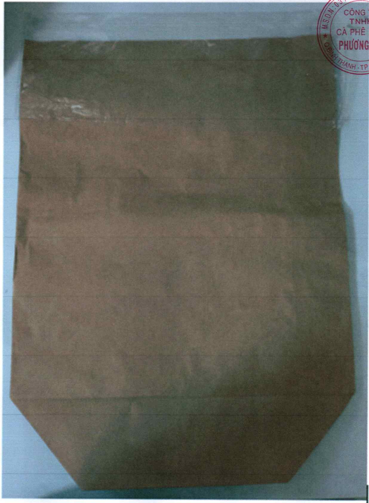
Túi PP lồng giấy chứa sản phẩm