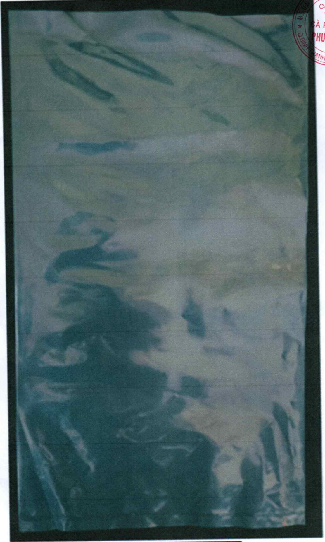
Túi PE chứa sản phẩm