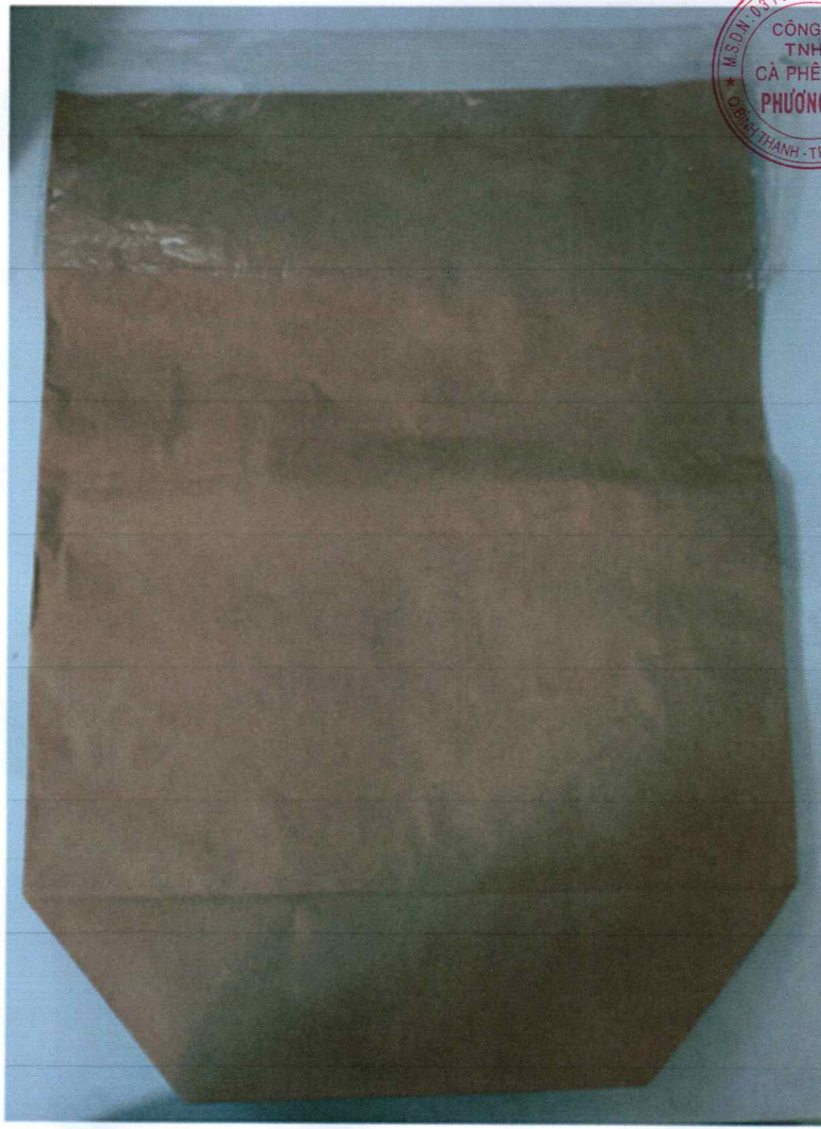
Túi PP lồng giấy chứa sản phẩm