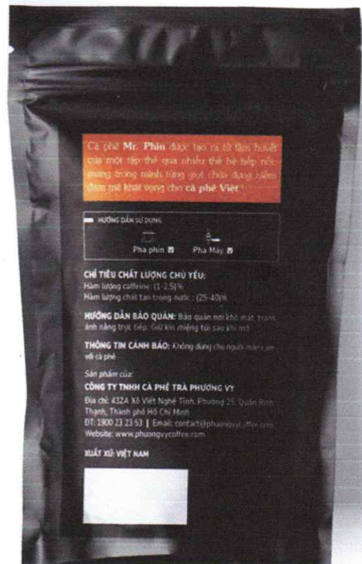
Bao bì sản phẩm “Cà phê pha phin truyền thống”