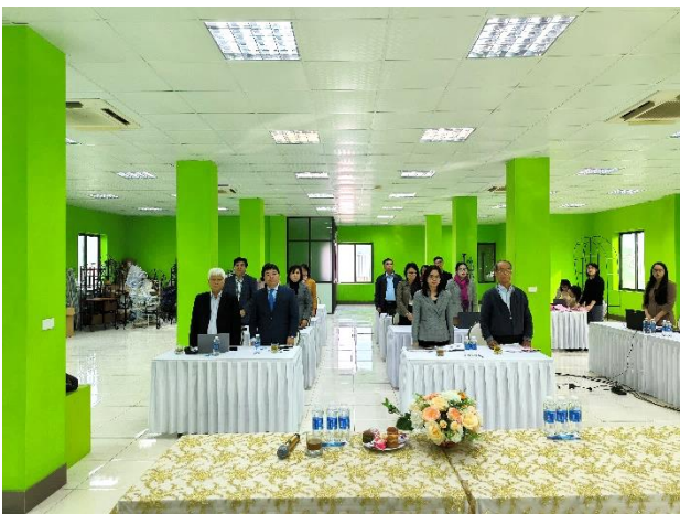
Các Cổ đông tiến hành tiến hành làm lễ chào cờ