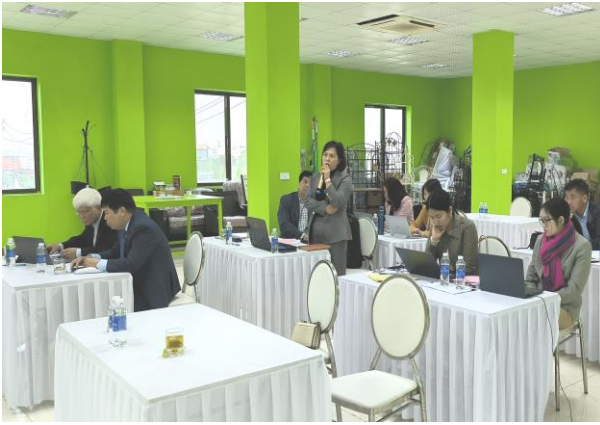
Cổ đông tham dự họp phát biểu ý kiến