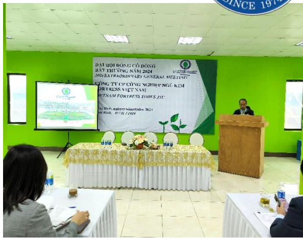
Chủ tịch HĐQT phát biểu khai mạc Đại hội