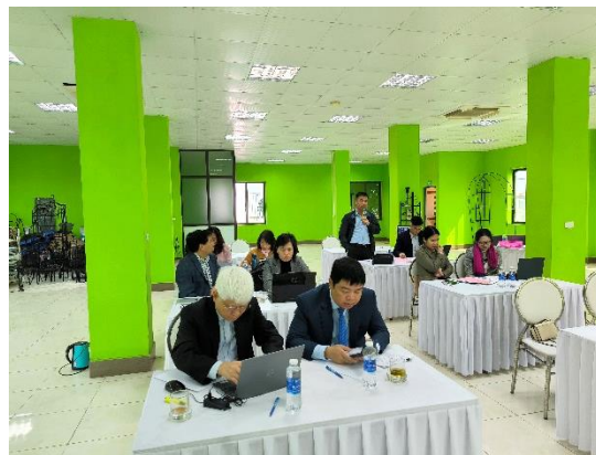
Cổ đông tham dự họp phát biểu ý kiến