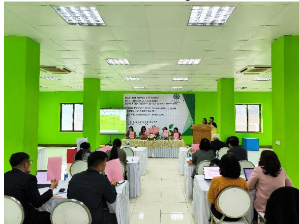
Đại hội tiến hành biểu quyết công khai