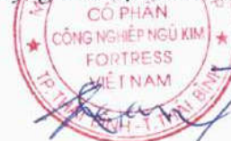
TSAI CHUI TIEN